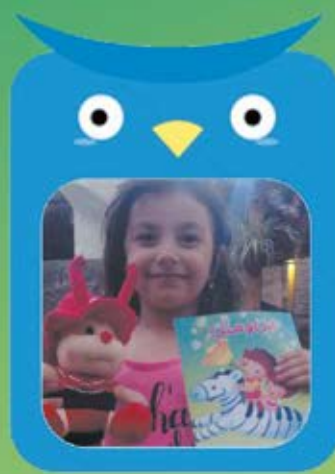
عسل از کربلا